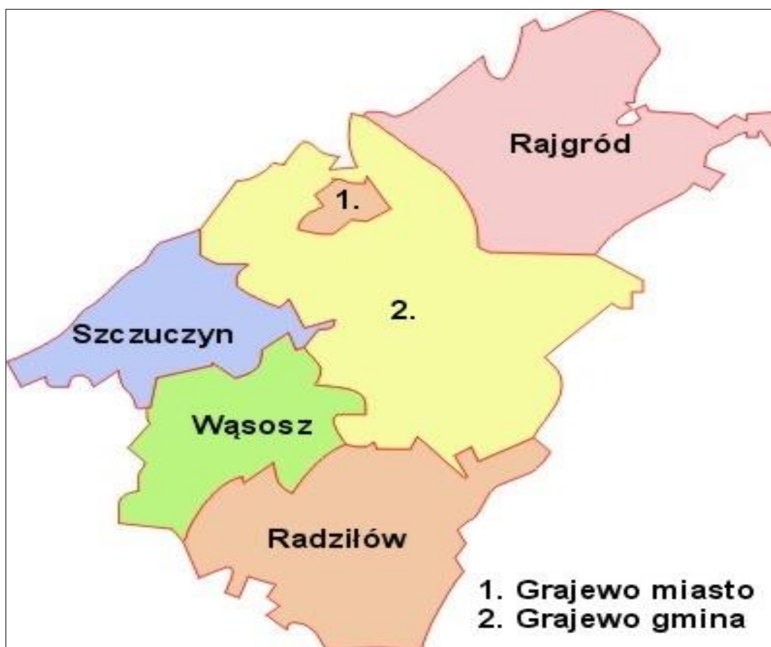
Rycina 1 Położenie Gminy Rajgród na tle powiatu grajewskiego.