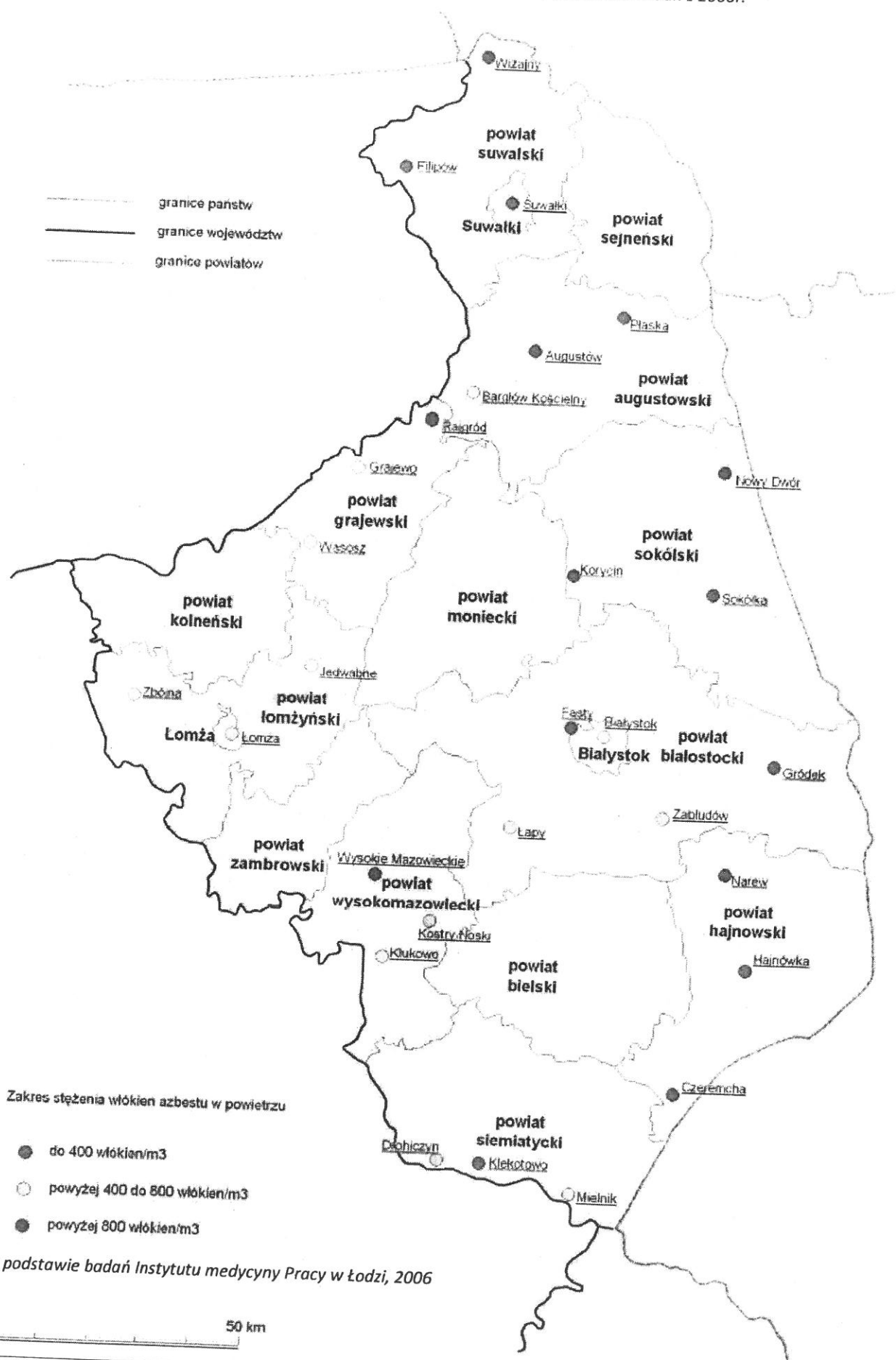
Rysunek 1. Stężenie włókien azbestu w powietrzu w woj. podlaskim na podstawie badań z 2006r.